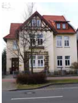
PFARRHAUS Bahnhofstr. 11a, Bückeburg