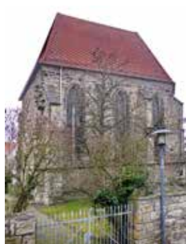
KLOSTERKIRCHE Klosterstraße, Stadthagen