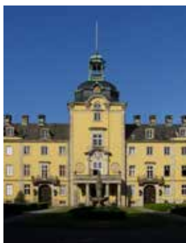
SCHLOSSKIRCHE Schloss Bückeburg