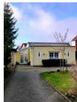
GEMEINDEHAUS Bahnhofstr. 11a, Bückeburg