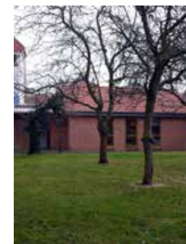
GARTENHAUS neben der Klosterkirche