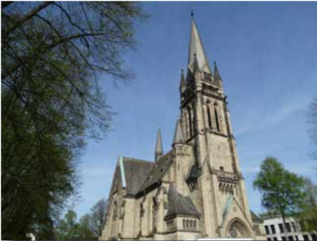
Christuskirche in Detmold