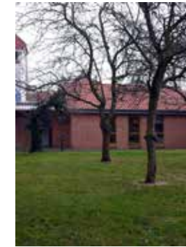
GARTENHAUS neben der Klosterkirche