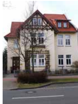
PFARRHAUS Bahnhofstr. 11a, Bückeburg