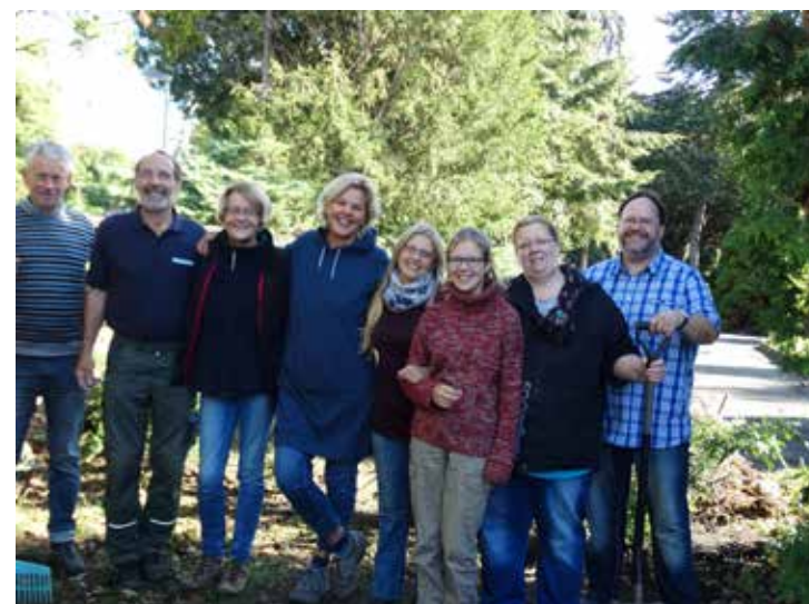
Arbeitseinsatz auf dem Tierfriedhof