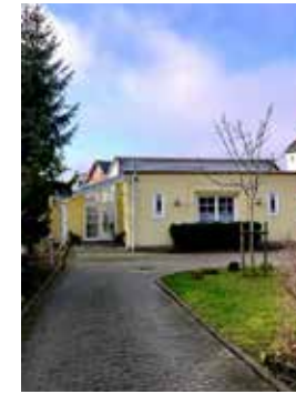
GEMEINDEHAUS Bahnhofstr. 11a, Bückeburg