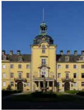
SCHLOSSKIRCHE Schloss Bückeburg