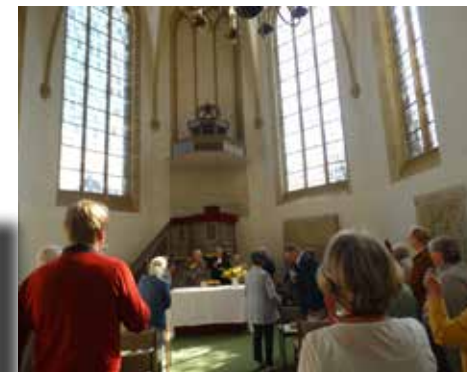
Gemeindefest am 9.9. in Stadthagen