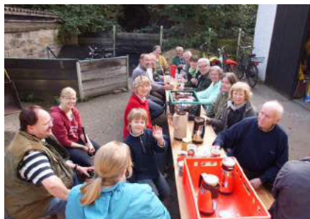
18 Aktivisten auf unserem Friedhof