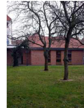
GARTENHAUS neben der Klosterkirche