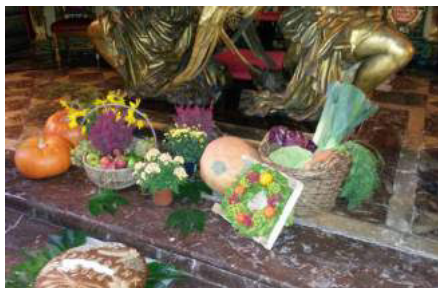
Gaben zum Erntedankfest in der Schlosskirche