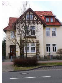
PFARRHAUS Bahnhofstr. 11a, Bückeburg