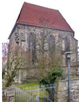
KLOSTERKIRCHE Klosterstraße, Stadthagen