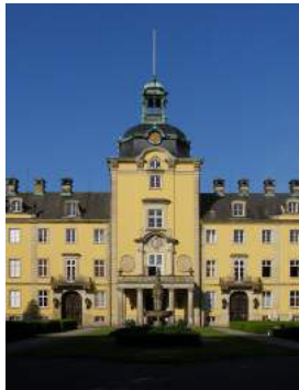
SCHLOSSKIRCHE Schloss Bückeburg