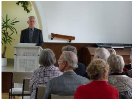
Im September fand das Gemeindefest statt