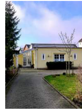
GEMEINDEHAUS Bahnhofstr. 11a, Bückeburg