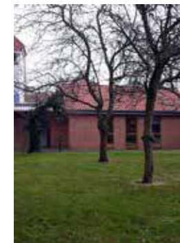
GARTENHAUS neben der Klosterkirche