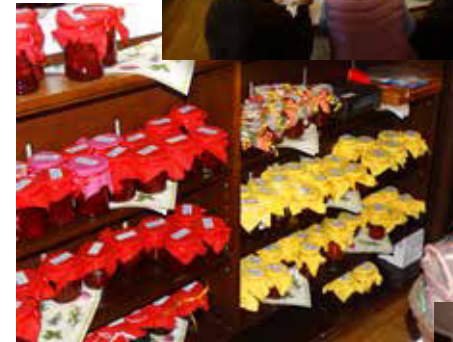
Fröhliches Treiben beim Basar 2015