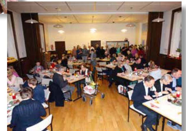
Gemütliches Beisammensein bei der Weihnachtsfeier 2015 in Bückeberg