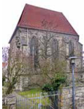
KLOSTERKIRCHE Klosterstraße, Stadthagen