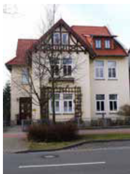
PFARRHAUS Bahnhofstr. 11a, Bückeburg