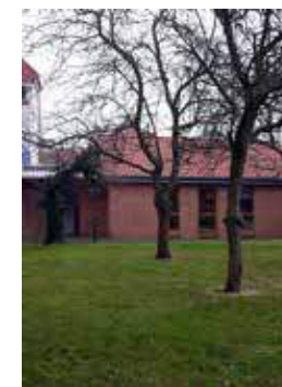
GARTENHAUS neben der Klosterkirche