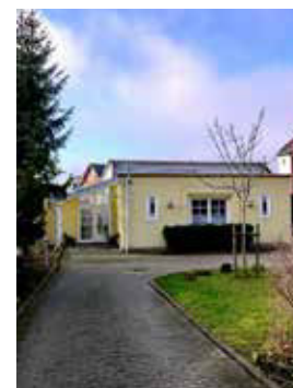
GEMEINDEHAUS Bahnhofstr. 11a, Bückeburg