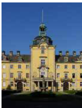
SCHLOSSKIRCHE Schloss Bückeburg