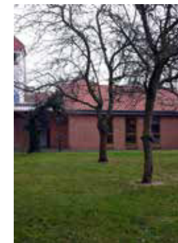
GARTENHAUS neben der Klosterkirche